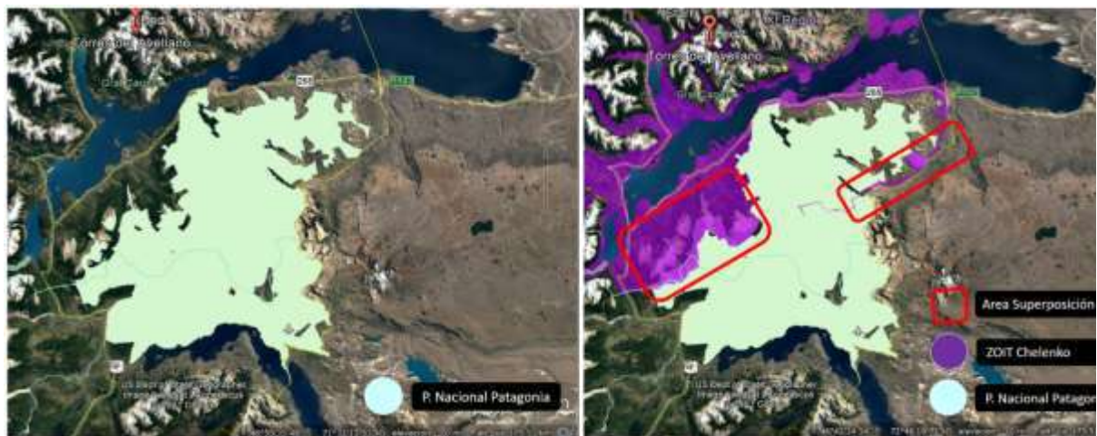
Figura 1. Disminución superficie polígono ZOIT Chelenko por ajuste a limite PN Patagonia

Al crearse el actual parque Patagonia se fusionaron la ex Reserva Nacional Lago Jeinimeni y la ex Reserva Nacional Lago Cochrane (Tamango); incluyendo el sector de Valle Chacabuco. Además, se sumaron nuevas áreas, y con ello la nueva ASP creada, contempla una superficie mayor a la original, superponiéndose al polígono ZOIT Chelenko en el área Sur de la localidad de Pto. Guadal y camino acceso al área de administración del área Jeinimeni del PN Patagonia. De esta manera y con el objeto de apegarse a la normativa se resta al polígono ZOIT original, el área de superposición con PN Patagonia.