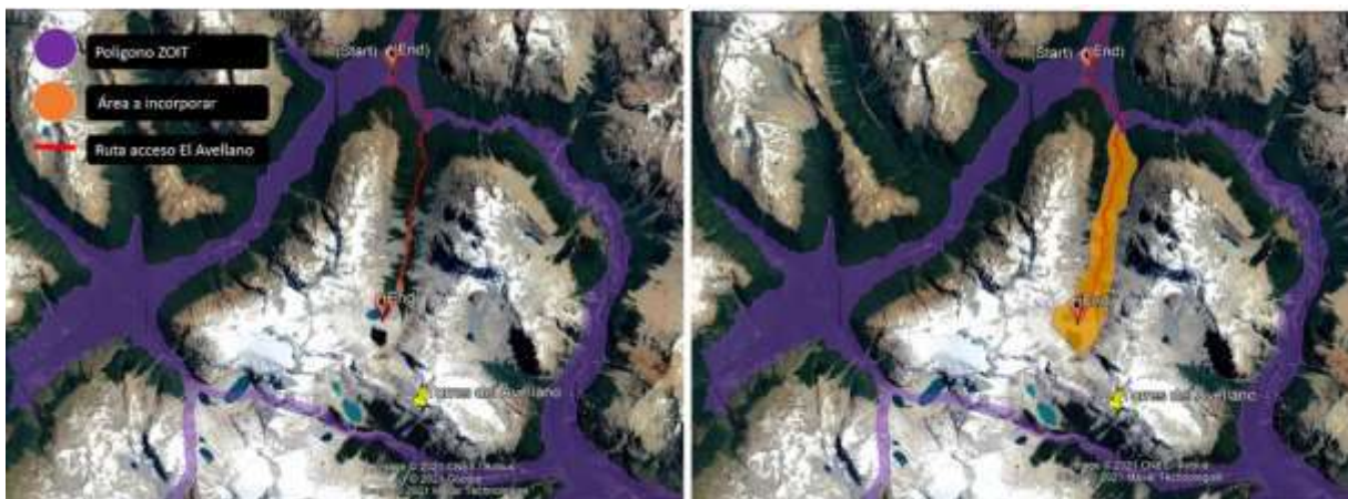
Figura 2: Incorporación área Ruta de acceso Torres del Avellano

En torno al lugar en cuestión se desarrollando una creciente actividad asociada al montañismo y escalada. El área de El Avellano, puntualmente “las Torres del Avellano” cuenta con reconocimiento principalmente a nivel internacional 2 . No obstante, lo anterior, la actividad turística asociada a este atractivo (y a esta ruta de acceso en particular) se está dando de manera espontánea, generando problemas principalmente asociados a la seguridad de quienes visitan el área, más algunos focos menores de contaminación y problemas con pobladores del lugar. Si bien existen operadores locales, debidamente registrados en Sernatur, trabajando en el área de manera coordinada con pobladores, se requiere apoyar de manera coordinada el desarrollo de la actividad en el sector.